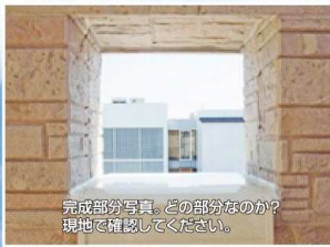
完成部分写真。どの部分なのか？ 現地を確認してください。